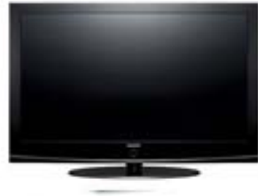
Pantalla de plasma 50" Ref. PS50P96FD