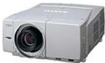
SANYO de 5000 lumens Ref. PLC XP51