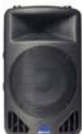
Sonido autoamplificados Ref. alto Ps4la "Con trípode"