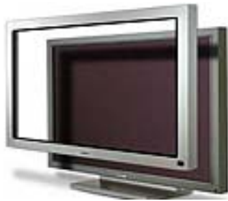
Pantalla táctil Ref. PD-50HW2A