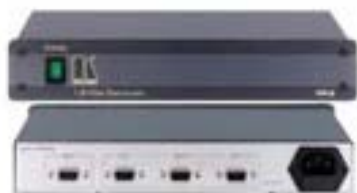
Distribuidor de señal VGA de 1 in a 4 out