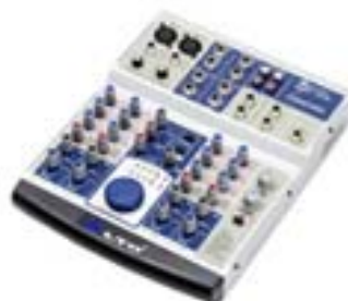
ALTO AMX 100 FX MESA EFECTOS Ref. LT240