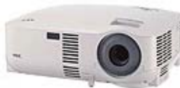
NEC de 2000 lumens Ref. LT240