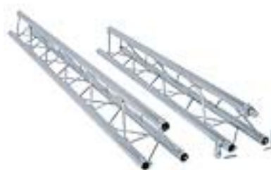
Truss ferial de 2 m. , 1,5 m, ángulos..