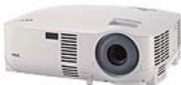
NEC de 2500 lumens Ref. LT695