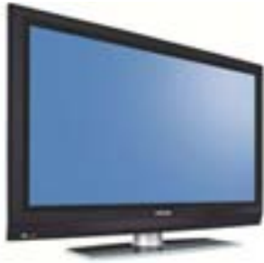
Pantalla de plasma 42" Ref. 42PFP5532D